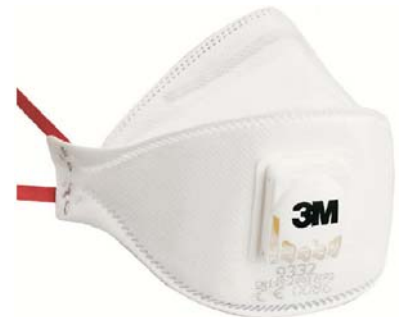
3M FFP3/D NR-D CE Scatola da 10. Imbustate singolarmente cod. 3M 9332