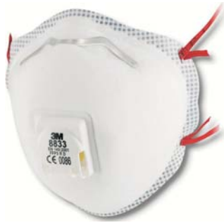
3M FFP3/D NR-D CE Scatola da 10 cod. 3M 8833

MASCHERINE ANTIPOLVERE FFP3 LE CLASSICHE CON FORMA A CONCHIGLIA PER POLVERI TOSSICHE, fumi, nebbie e aerosol solidi e liquidi di cl.3 a norma UNI EN 149/2001