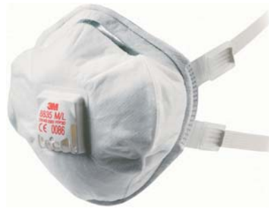
3M FFP3/D NR-D CE Scatola da 5 cod. 3M 8835