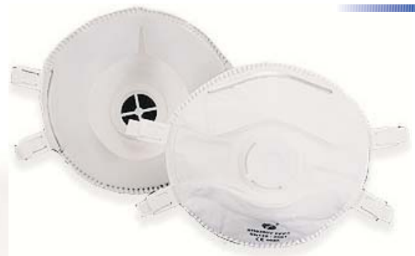
FFP3/V NR-D CE Scatola da 5 cod. PM 009