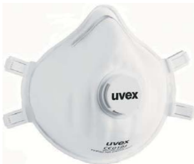
uvex FFP3/D NR-D CE Scatola da 5 cod. UVEX 2310